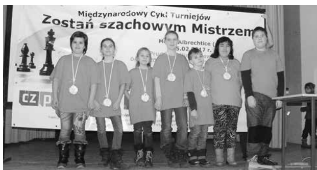
družstvo mladých mikulovických šachistů