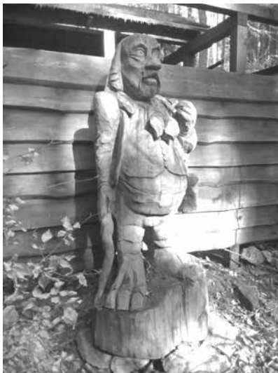
Vodník u Priessnitzovy sprchy

V jednom z loňských čísel Informačního servisu jsem vás pozvala na návštěvu Priessnitzových léčebných lázní. Toto místo je ale tak bohaté na nádherná místa, že mi to nedalo a opět vám nabízím něco z jeho krás. První březnový víkend nám meteorologové nabízeli nádherné počasí, a to se pak i potvrdilo. Padaly teplotní rekordy a celý víkend byl jako stvořený pro procházky a výlety. Měla jsem obavy, že v tyto dny budou lázně plné návštěvníků a turistů, ale nepotvrdilo se mi to. Ráda bych vás tedy pozvala na Studniční vrch na výlet po Naučné stezce Živé vody, která byla otevřena v roce 2010 a navazuje na stezku Vincenze Priessnitz. Výlet začneme u Informačního centra lázní. Trasa je značena fialovými trojúhelníky s dvěma proužky stejné barvy. Po 1,5 km se dostaneme k Jitřnímu pramenu, výchozímu místu stezky a je zde první panel s číslem 1. Takových panelů je po cestě rozmístěno celkem 10 a na každém z nich si můžeme přečíst za-