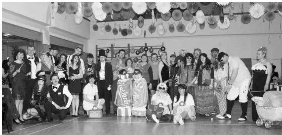
Maškarní ples - retro párty