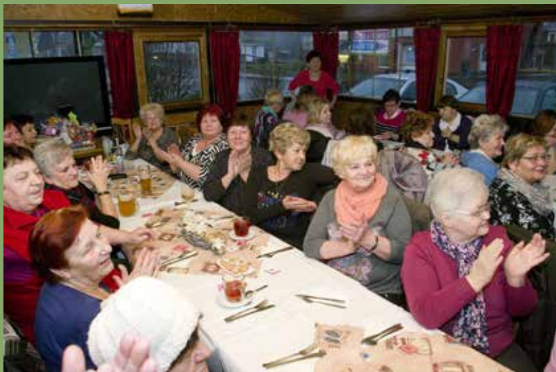
MSŽ - oslava MDŽ 8. 3. 2016

Příspěvky do Informačního servisu zasílejte pomocí formuláře, který najdete na webových stránkách obce: www.mikulovice.cz v rubrice Informační servis.