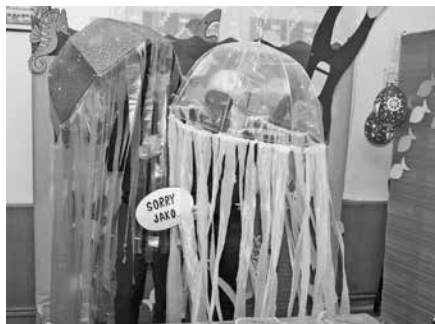
Vítězné masky - maškarní ples