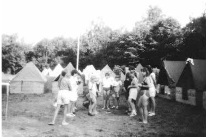
Skauti Mikulovice - Letní stanový tábor Horní Domašov 2002