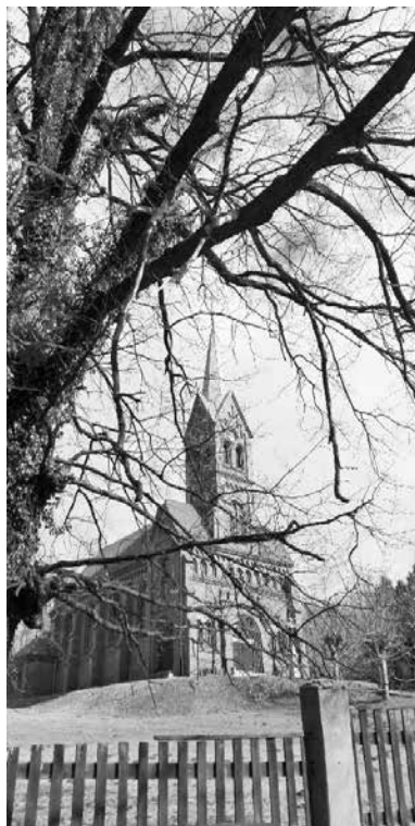
Kostel sv. Jiří v Podlesie