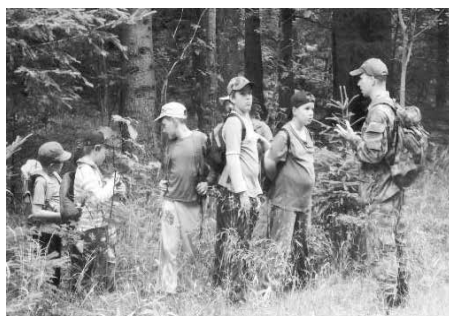
Skauti Mikulovice - Letní stanový tábor Kurz přežití 2017