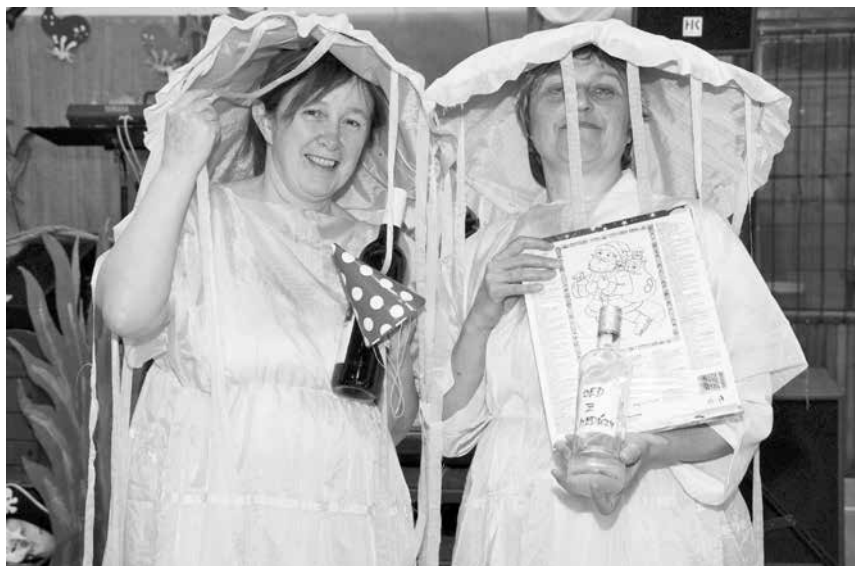
Medúzy - maškarní ples