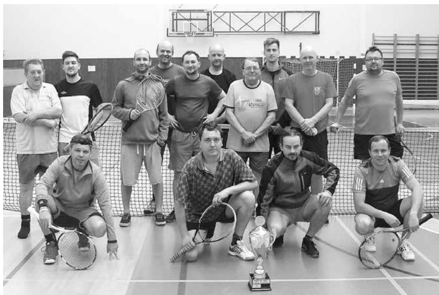
Účastníci halového tenisového turnaje v Mikulovicích