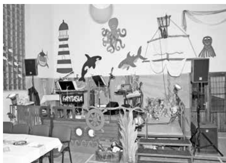
Výzdoba maškarního plesu