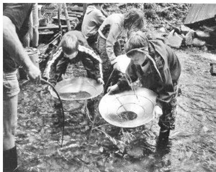
Skauti Mikulovice - Letní tábor zlatokopů 2006