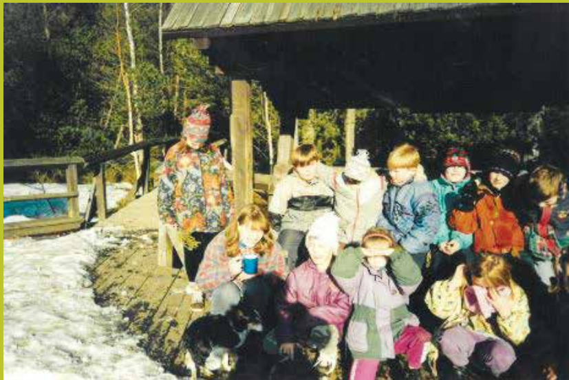
Zimní výprava Rejvz - Mechové jezírko 2002

Příspěvky do Informačního servisu zasílejte pomocí formuláře, který najdete na webových stránkách obce: www.mikulovice.cz v rubrice Informační servis.