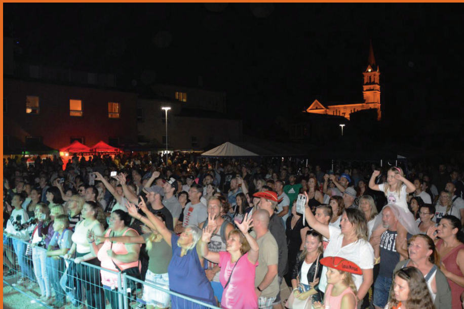
Mikulovické dny 2021