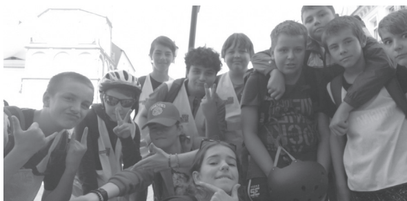
Letní tábor - na výletě v polském Paczkowě