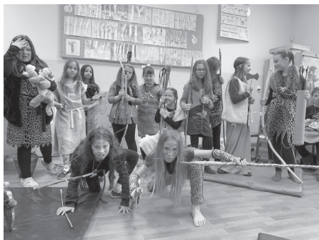
Jak se žilo v pravěku