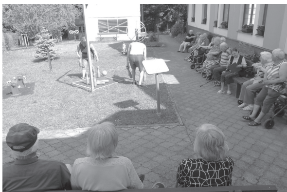
Ruské kuželky na zahradě v DPS