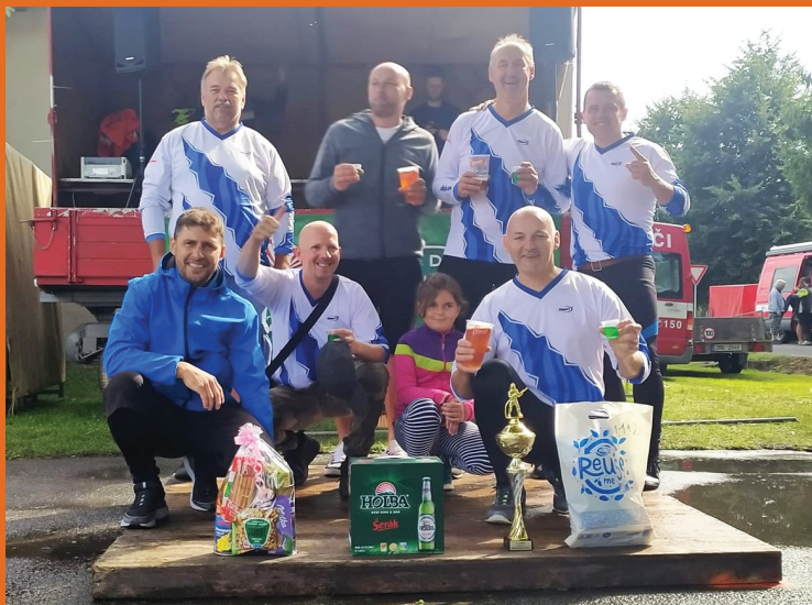
Družstvo SDH Široký Brod po vítězství v letošním ročníku Holba Cupu v kategorii veteránů

Příspěvky do Informačního servisu zasílejte pomocí formuláře, který najdete na webových stránkách obce: www.mikulovice.cz v rubrice Informační servis. Periodický tisk územního samosprávného celku. Číslo 2/2021. Datum vydání 1. 10. 2021. Zdarma. Náklad 1020 výtisků. Vydává obec Mikulovice 790 84, Hlavní 5, IČ: 00303003, MK ČR E 21462.