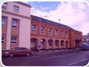
OBECNÍ ÚŘAD V NOVÉM