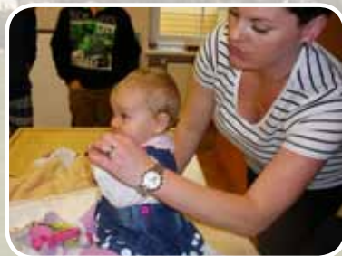
PÉČE O DÍTĚ