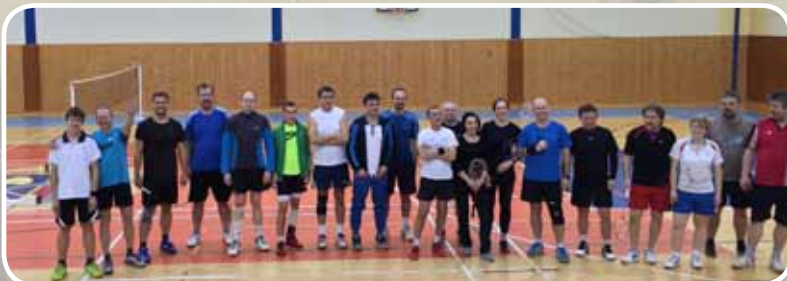
TURNAJ V BANDMINTONU