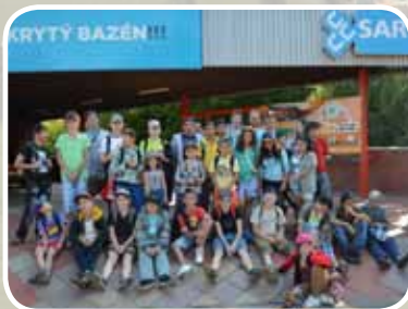
LETNÍ TÁBOR - MUNA