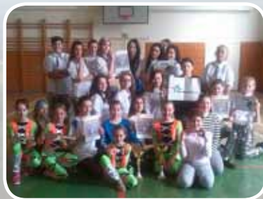
TANEČNÍ SOUBOR NEW FLASH