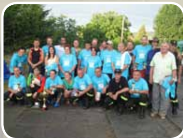
ŽELEZNÝ HASIČ JESENICKA