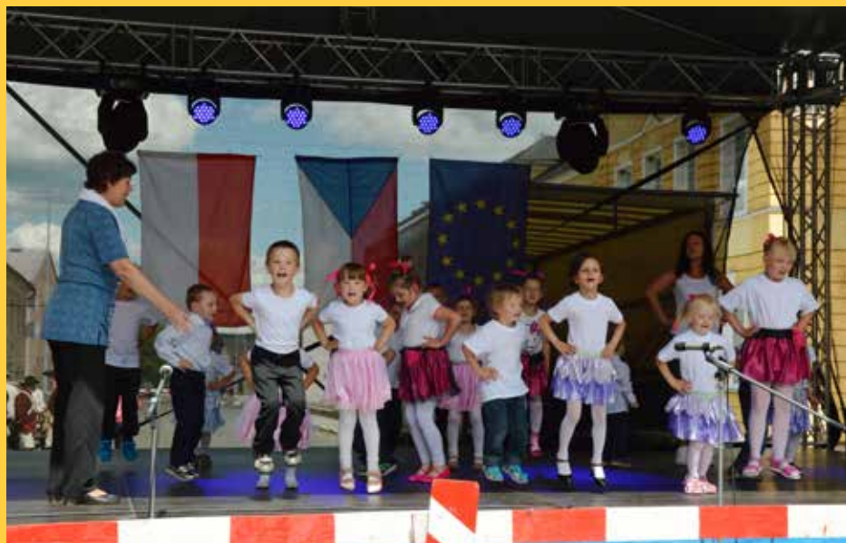
MŠ Široký Brod - Kulturní léto 2016 - Dny obce Mikulovic