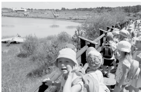
MŠ Mikulovice - Jurapark Krasiejow