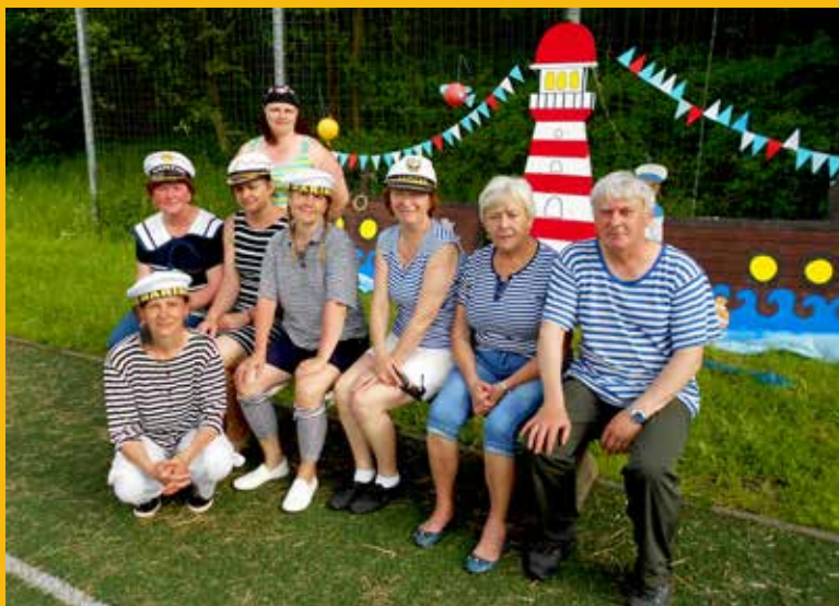
MSRPDŠ - Námořnický den dětí

Příspěvky do Informačního servisu zasílejte pomocí formuláře, který najdete na webových stránkách obce: www.mikulovice.cz v rubrice Informační servis. Uzávěrka příspěvků čísla 5/2019 je dne 1. 11. 2019 do 12:00 hod. Informační servis. Periodický tisk územního samosprávného celku. Vychází jedenkrát za dva měsíce. Číslo 4/2019. Datum vydání 9. 9. 2019 Zdarma. Příští vydání listopad 2019. Náklad 1 020 výtisků. Vydává obec Mikulovice 790 84, Hlavní 5, IČ: 00303003, MK ČR E 21462.