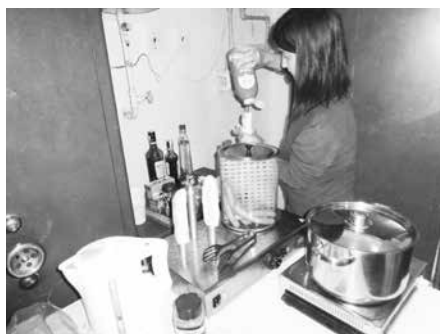
Branný den aneb Jak to bylo dříve