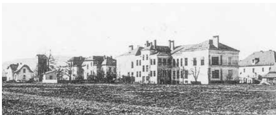
Nezvyklý pohled na mikulovickou školu od severu (tedy zezadu) v době, kdy ještě nebylo postaveno křídlo budovy se starou tělocvičnou