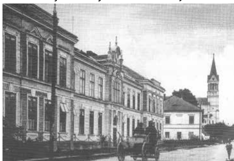
Mikulovická škola na počátku minulého století