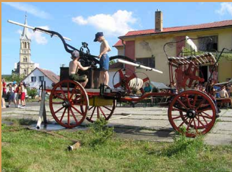
Koňská stříkačka z roku 1909

Příspěvky do Informačního servisu zasílejte pomocí formuláře, který najdete na webových stránkách obce: www.mikulovice.cz v rubrice Informační servis.