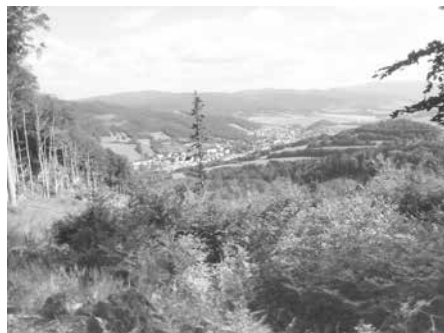
pohled z Heckelovy vyhlídky