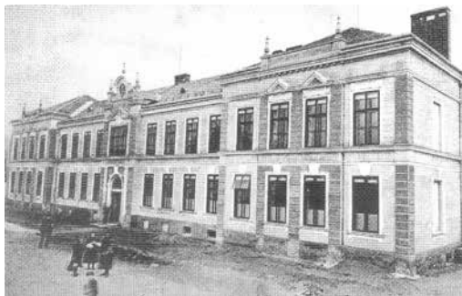
Mikulovická škola těsně po výstavbě - zemní práce okolo školy ještě nejsou dokončeny