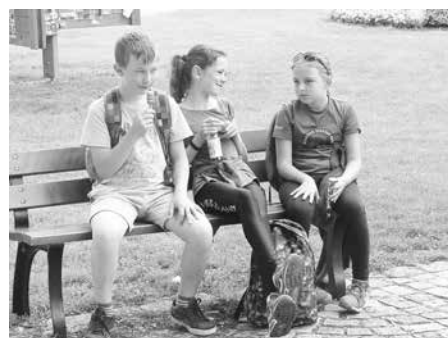
Letní tábor Líšnice 2017