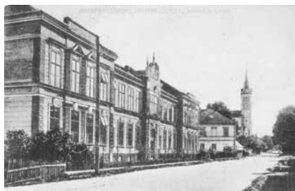
Hlavní ulice se školou a kostelem