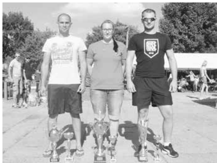
Železný hasič - vítězové