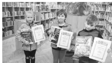
Týden knihoven - výherci soutěže