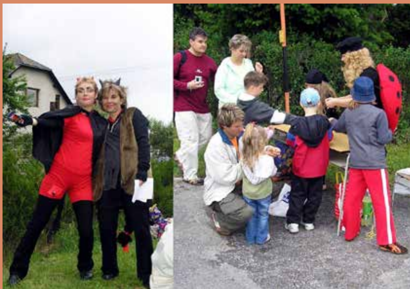
Jedna vzpomínková - Dětský den červen 2007

Příspěvky do Informačního servisu zasílejte pomocí formuláře, který najdete na webových stránkách obce: www.mikulovice.cz v rubrice Informační servis.