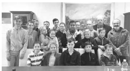
Trochu jiná škola - Sveržov