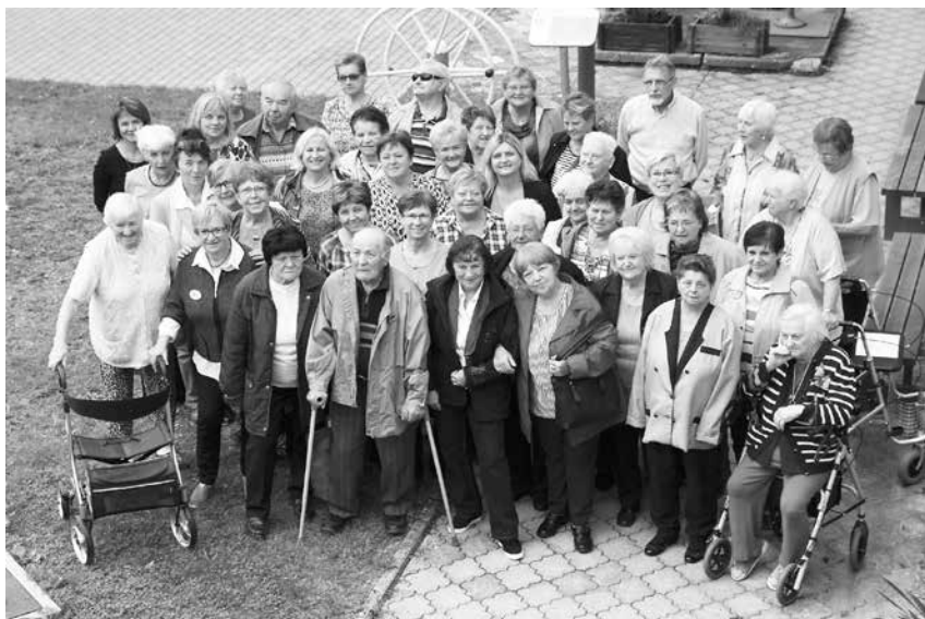
Týden seniorů - společenské odpoledne