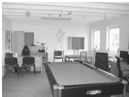
NZDM - nové prostory