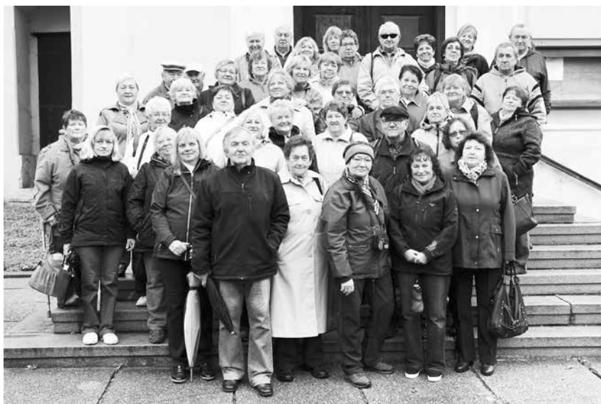
Týden seniorů - Javornicko