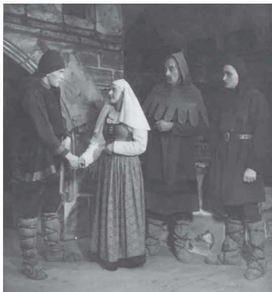
V poválečných letech působil v Mikulovicích divadelní spolek Jirásek