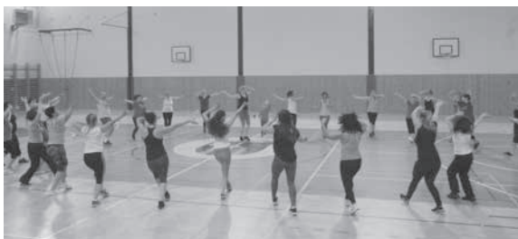
Relax day 2016