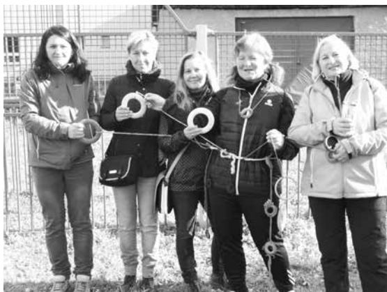
MSRPDŠ - kolečkařáda