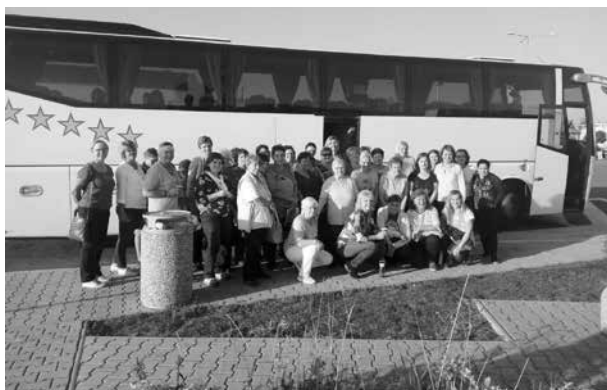
Zájezd MSŽ do Prahy