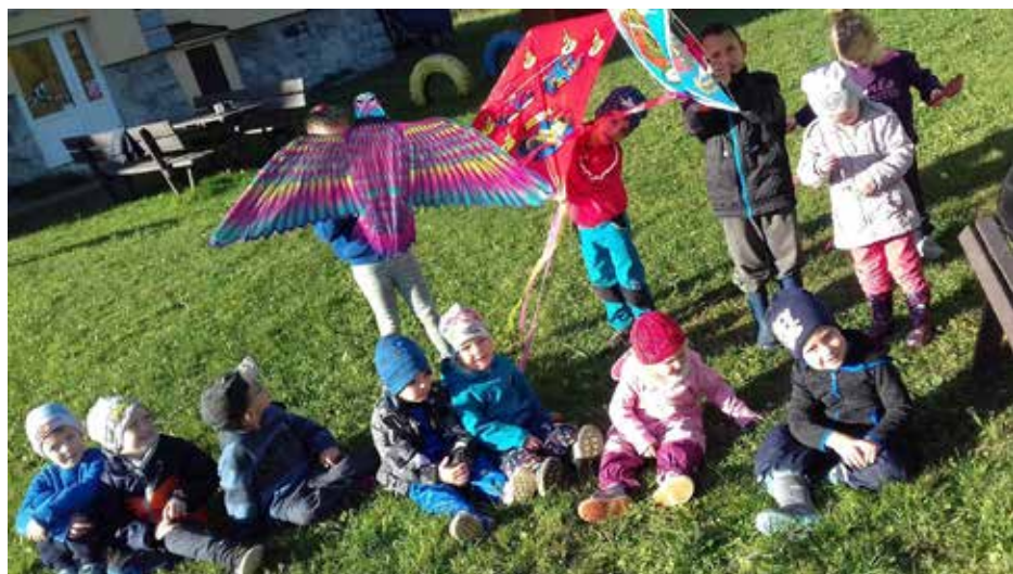
Mateřská škola Široký Brod

Příspěvky do Informačního servisu zasílejte pomocí formuláře, který najdete na webových stránkách obce: www.mikulovice.cz v rubrice Informační servis. Uzávěrka příspěvků čísla 1/2020 je dne 13. 1. 2020 do 12:00 hod. Informační servis. Periodický tisk územního samosprávného celku. Vychází jedenkrát za dva měsíce. Číslo 5/2019. Datum vydání 25. 11. 2019. Zdarma. Příští vydání únor 2020. Náklad 1 020 výtisků. Vydává obec Mikulovice 790 84, Hlavní 5, IČ: 00303003, MK ČR E 21462.