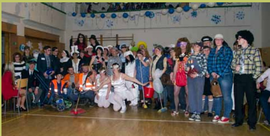
Maškarní ples - Ten dělá to a ten zas tohle - MSRPDŠ

Člověk nedělá vždycky, co je správné. Dokonce ani, když to ví. V tom někdy bývá kouzlo života. Remarque