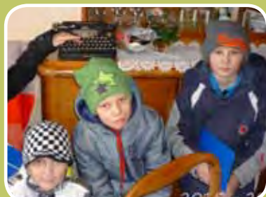
NÁVŠTĚVA U POHÁDKOVÉ BABIČKY