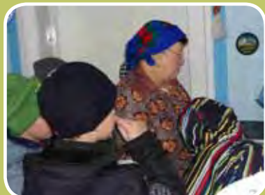
NÁVŠTĚVA U POHÁDKOVÉ BABIČKY