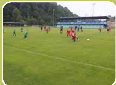
FK MIKULOVICE - ZÁPAS NEJMLADŠÍCH