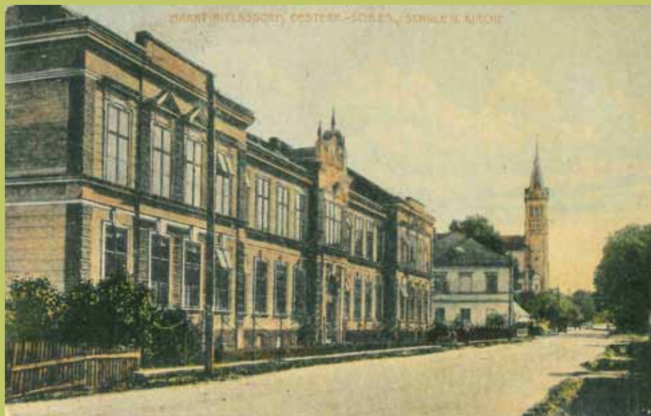
budova školy kdysi