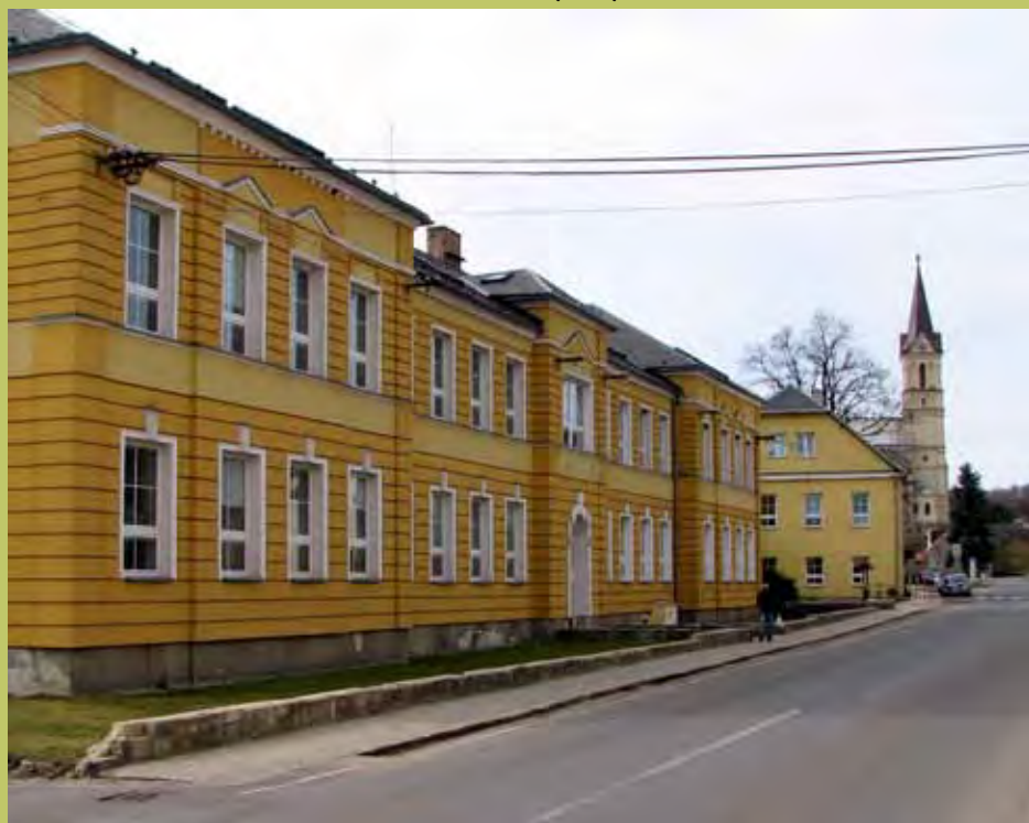
budova školy dnes