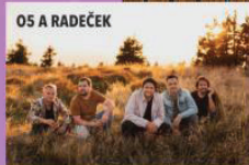
OS A RADEČEK