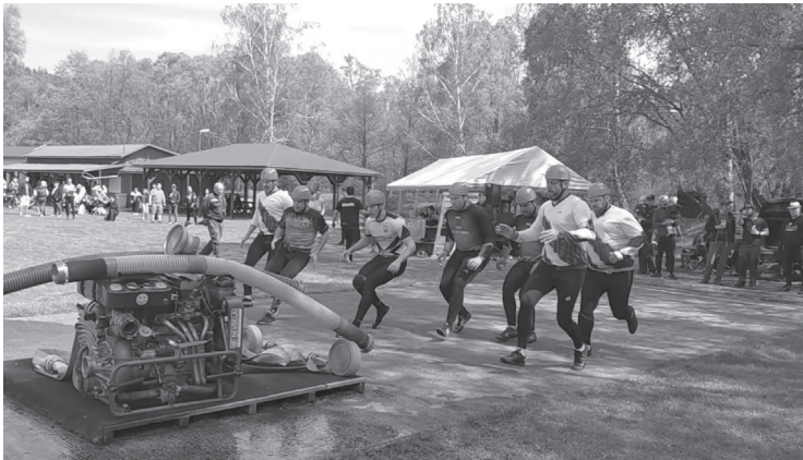
Hasiči z Širokého Brodu na závodě Hasičské ligy Praděd