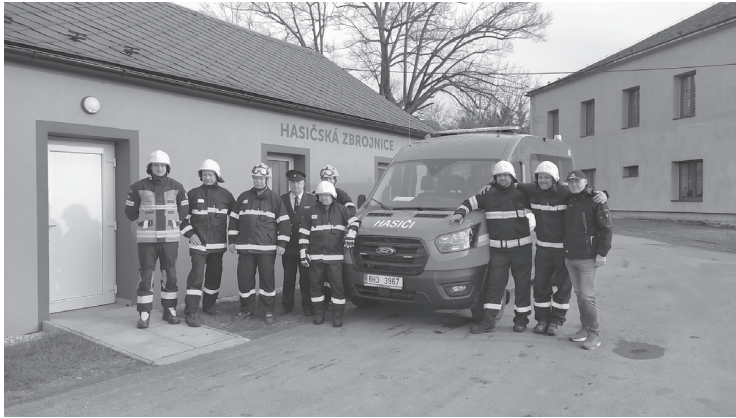
Hasiči z Širokého Brodu obdrželi nový Ford Tranzit 4 x 4