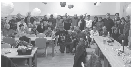
Hasiči Široký Brod