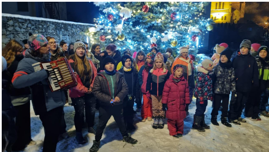
Zpívání u vánočního stromečku

Příspěvky do Informačního servisu posílejte pomocí formuláře, který najdete na webových stránkách obce: www.mikulovice.cz v rubrice Informační servis. Periodický tisk územního samosprávného celku. Vychází jedenkrát za tři měsíce. Číslo 1/2026. Datum vydání: 16. 2. 2026. Zdarma. Náklad 600 výtisků. Vydává obec Mikulovice 790 84, Hlavní 5, IČ: 00303003, MK ČR E 21462.