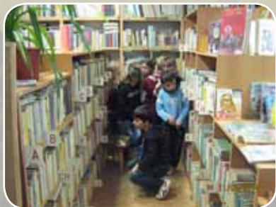
1. TŘÍDA ZŠ V KNIHOVNĚ