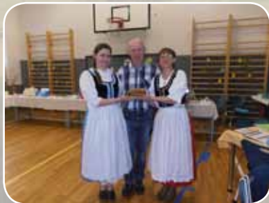
O NEJLEPŠÍ BÁBOVKU