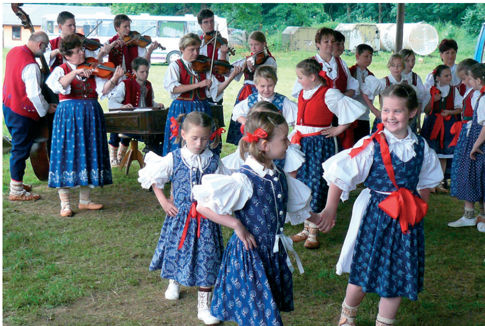
Na Dnech setkávání dětí, mládeže a dospělých v Mikulovicích vystoupil i dětský taneční soubor Valášek ze Zlatých Hor.